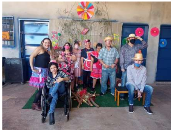
Vistas de Deputados