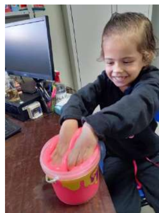
VISITA DOS ALUNOS A FEIRA DAS NAÇÕES NA ESCOLA DEPUTADO JOSÉ COSTA