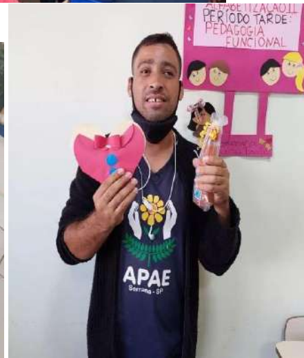
Capacitação Programa Mesa Brasil